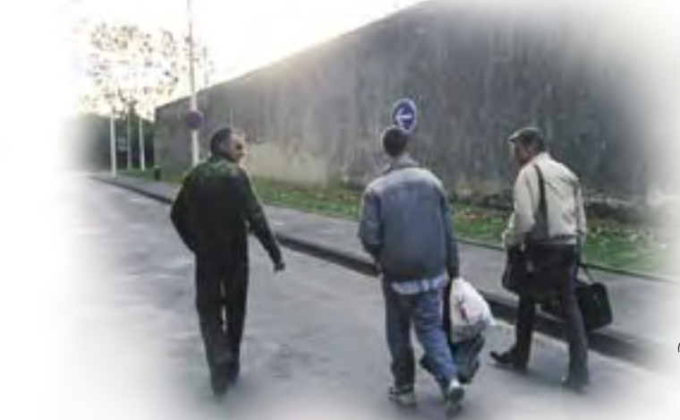
La sortie ....

Parallèlement, le développement des diverses échelles actuarielles a été suivi d'une inflation de la cote sécuritaire des condamnés, ceux-ci étant de plus en plus nombreux à être incarcérés dans des établissements très coercitifs, et donc plus coûteux en termes d'encadrement. Ce qui fait que le développement de ce processus scientifique a augmenté à la fois les contrôles physiques, mais également la pression psychologique subie par les condamnés.